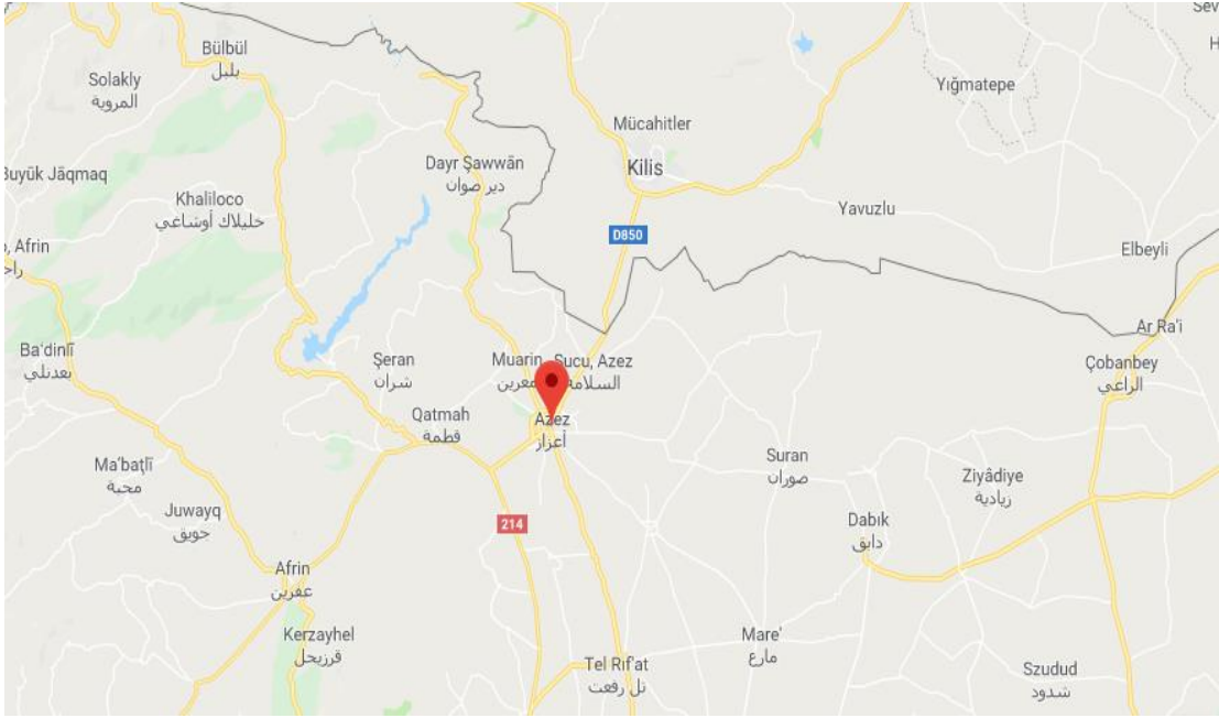
Grafik 1: Azez Coğrafi Konum

Burseya Dağı eteklerinde başlayan düzlüklerde kurulu olan yerleşim merkezinin rakımı 560 metre olup Akdeniz ikliminin karakteristik özelliklerine sahip bir iklim yapısı ve bitki örtüsü söz konusudur.